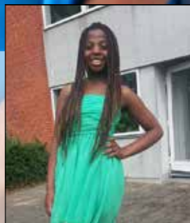
Sommeroutfit i Højvängen