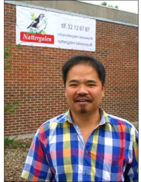
Tung foran sin nye restaurant "Nattergalen"

tage dem med hjem. Det var en helt vild og meget fantastisk oplevelse for mig!