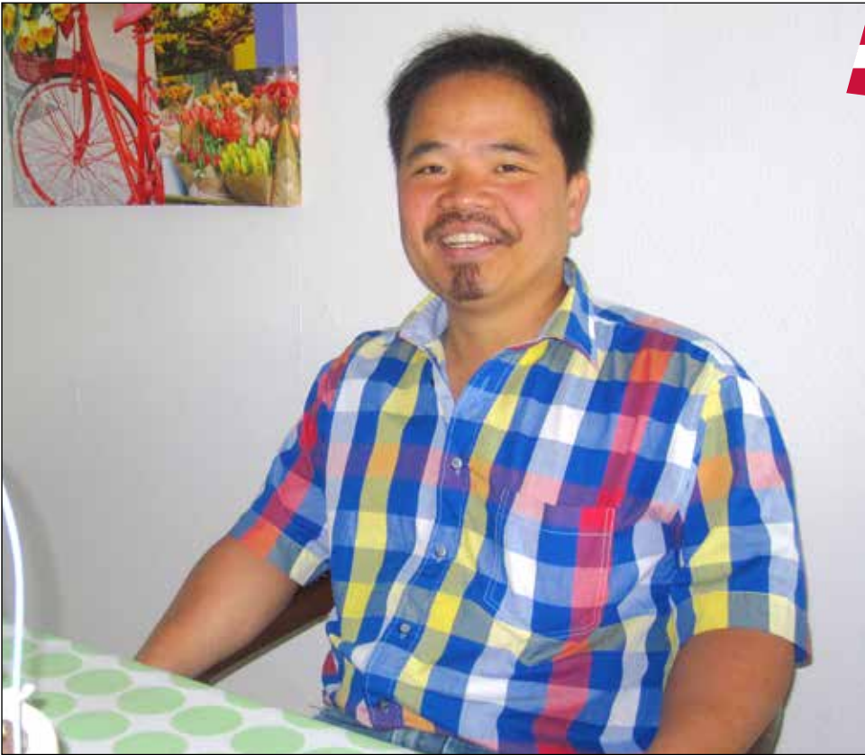
Vejen til Højvangen var lang og svær for Tung.