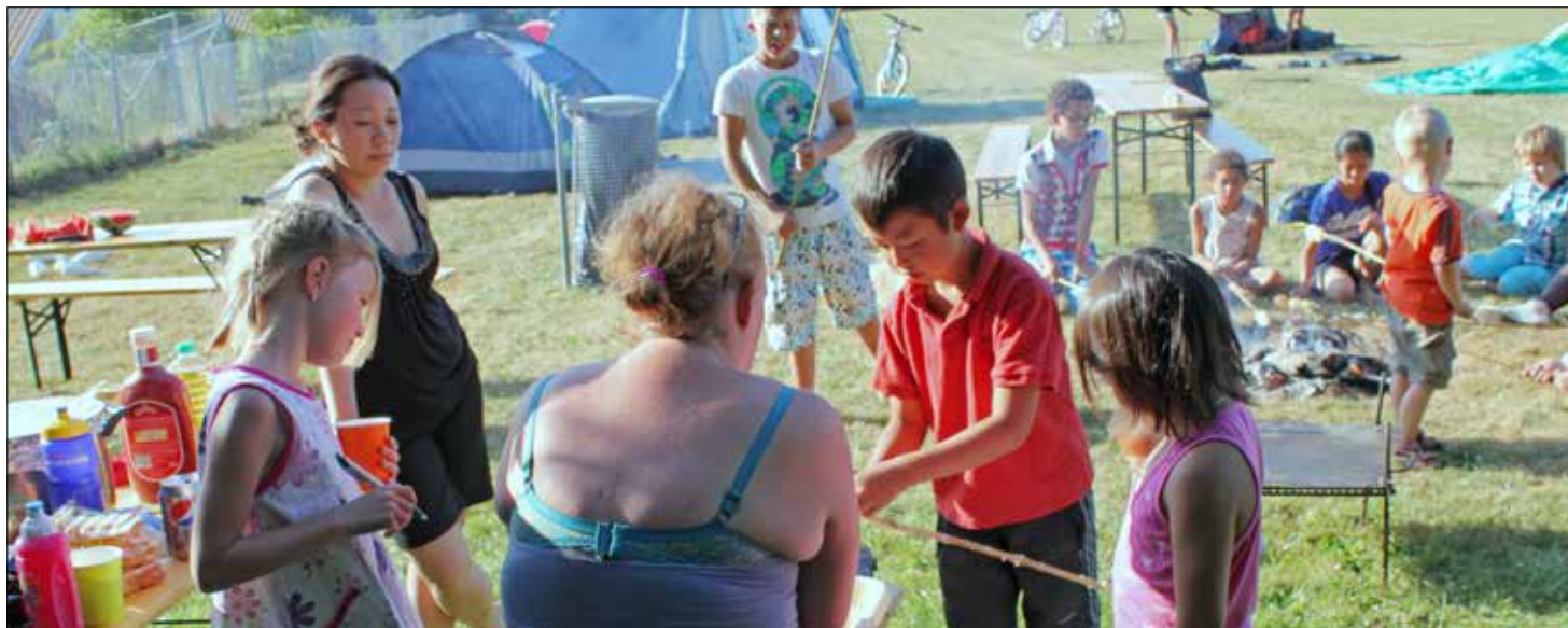
Højskolen byder på mange forskellige "familieoplevelser". Tag din familie med og få en gratis oplevelse