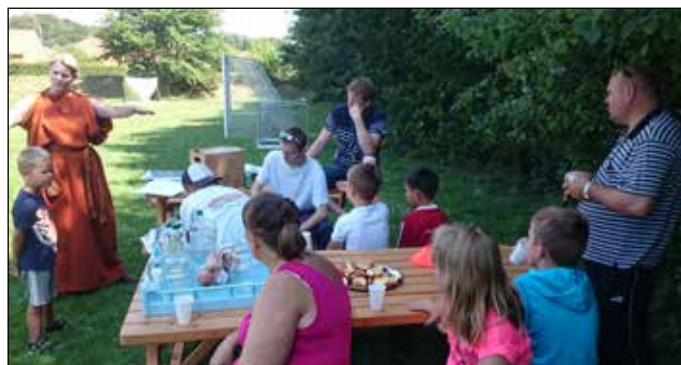
Sommersjov på Plænen med besøg fra Skanderborg Museum.