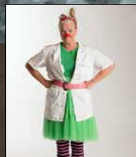
Mød Trudi i Højskolen