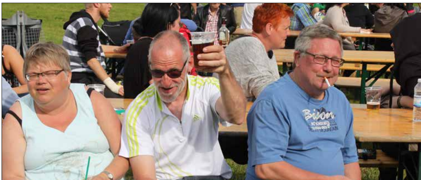
Naboer og andet "godt folk" mødes til sommerfest i Højvangen.

Vi lavede samme undersøgelse i 2012, så det bliver spændende at se, om der er sket en ændring siden dengang. I hører nærmere, når vi går i gang, sidst i oktober.