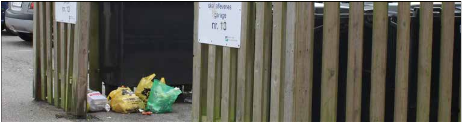
Kære beboere: HUSK at skraldeposerne skal OP i containerne!

møde, d.2.9.14. og nu er en ny Bestyrelse dannet. Navne og billeder kommer med i næste udgave af OPGANGEN i november.