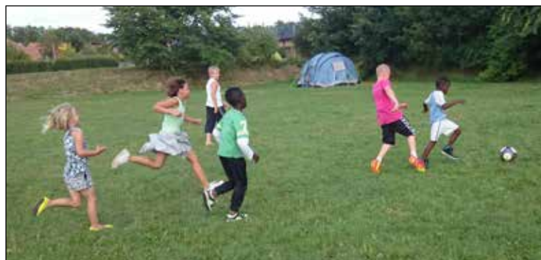
Fodbold på Plænen

Hver onsdag kl.: 19:00-21:00 for alle, Åndehullet Chr. Koldsvej 10, Gavlen.