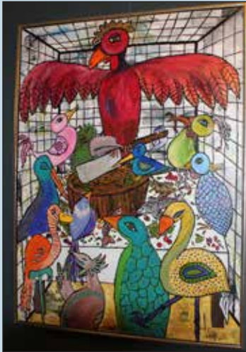
Katja Bach begyndte at male i den gamle kunstcafe

Først og fremmest er den et tilbud til alle med lyst til at forsøge sig med kunst. Men den er også for dem, der bare gerne vil smittes lidt af alle de kreative ideer, der forhåbentlig vil komme i caféen.