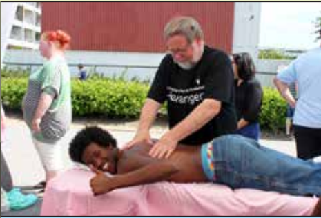
Mange kom på briksen i massageteltet