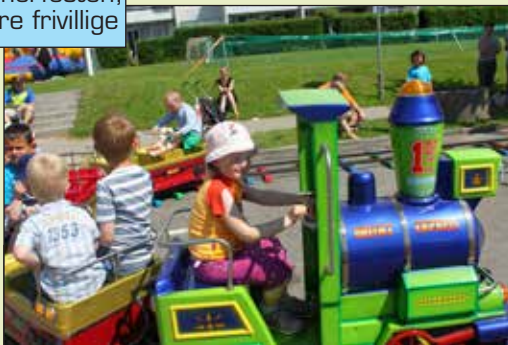
Toget for de mindste var meget populært