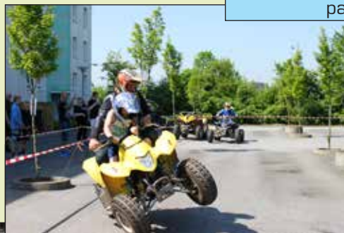
Efter cross opvisningen fik børnene lov til at prøve de store maskiner