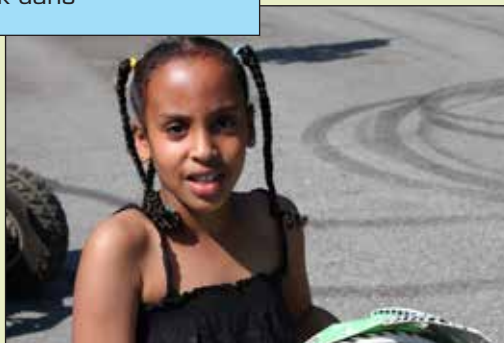
Pigerne var også vilde med cross