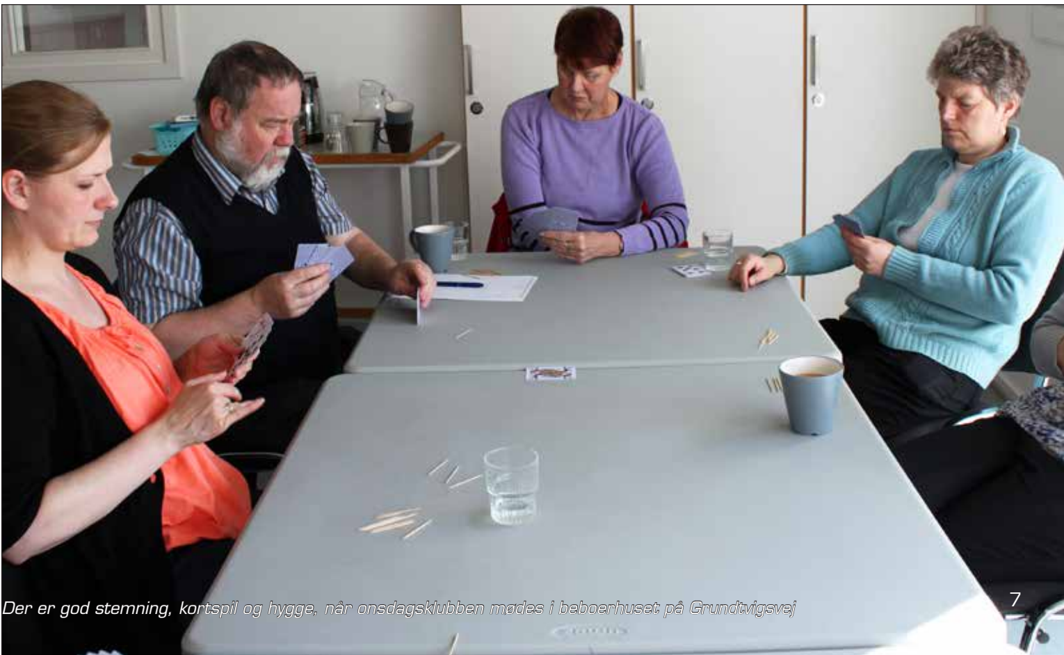
Der er god stemning, kortspil og hygge, når onsdagsklubben mødes i beboerhuset på Grundtvigsvej