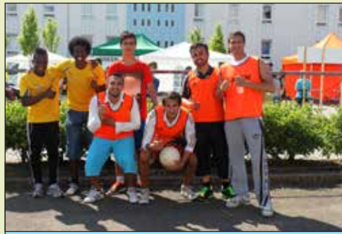
Hotspot og FC Skanderborg lavede fodbold turnering