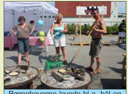
Børnehaverne lavede bl.a. bål og pandekager