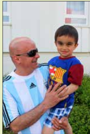
Far og søn hyggede til sommerfesten