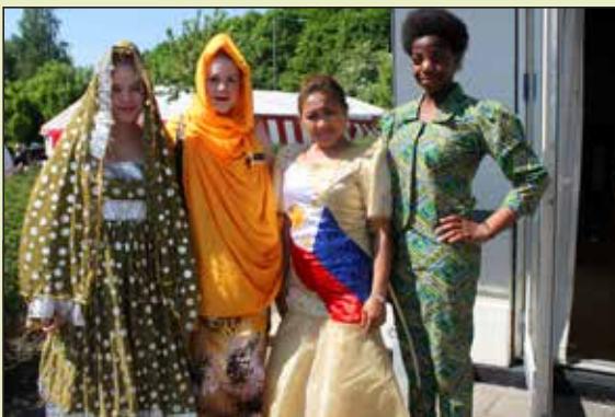
Mange forskellige kulturer repræsenteret i Højvangen