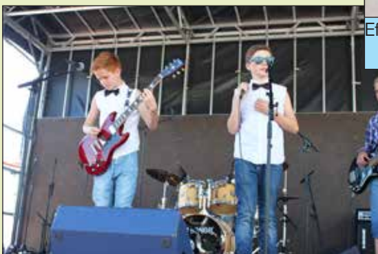
Danmarks yngste rockband gav den gas på scenen