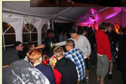
Sommerfestens højdepunkt for de unge i Ungeteltet, max god stemning