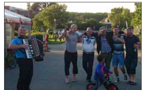
Bosnierne nød den meget dygtige serbiske harmonika spiller og havde en skøn fest

Det er rigtig godt at holde sommerfest her på Poul la Cours Vej. Det samler afdelingerne. Det er dejligt med socialt samvær. Vi savner en afdelingsbestyrelse i afd. 65, så det er rart at være med her. Der er også mere handicapvenligt her på Poul la Cours Vej, og det er jeg glad for.