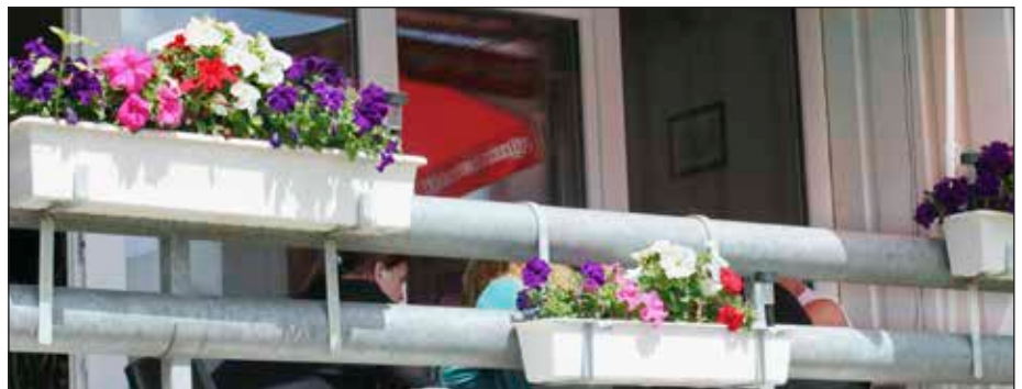
Der kan være meget smukt i Højvangen, her er det blomsterkasser der forskanner altanerne