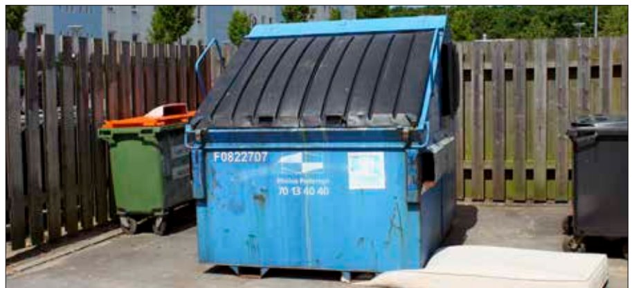
Brug de opstillede containere