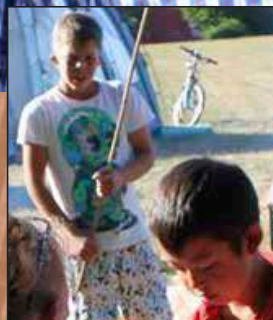
Tips til sommerferien