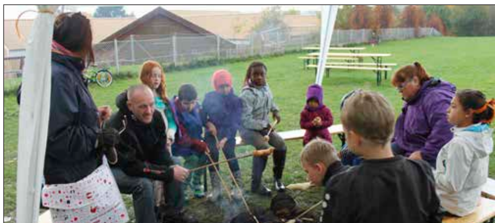
Selv bål og snobrød i regnvejr er hyggeligt

Vi får også besøg af "Ragnhild" fra vikingetiden i uge 31 – et besøg fra Skanderborg museum og vi er inviteret ned på museet i uge 32. Alt i alt bliver det nogle rigtig sjove aktiviteter, hvor hele familien kan være med. Vi håber meget, at jer forældre (og alle andre voksne) vil hjælpe til i løbet af sommerferien; enten ved at lege med, sætte boldspil i gang, lave bål, bage boller eller kage eller lave dej til snobrød og pandekager.