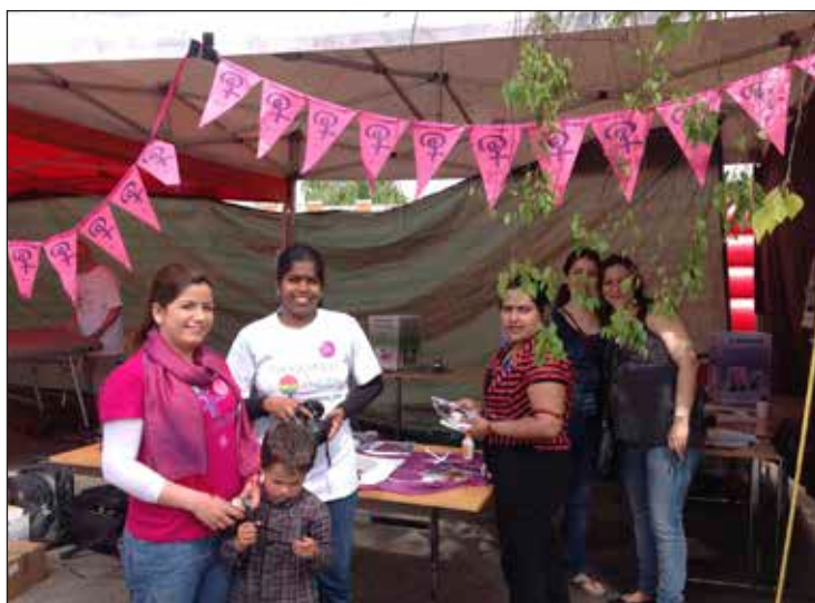
Bydelsmødre fra Højvangen.