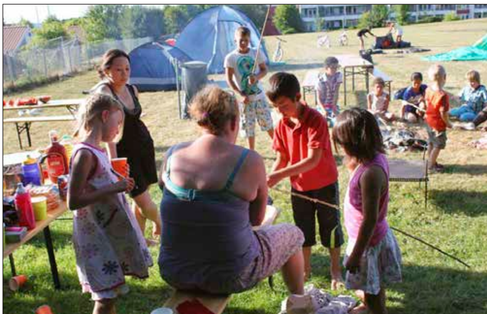
Der er aktiviteter og hygge på Plænen, bag børnehaven Regnbuen, hele sommerferien. Både for børn og voksne :-)