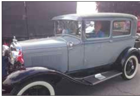
Vi fik besøg af flotte veteran biler, motorcykler og en militærlastvogn