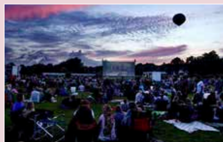
Zulu sommerbio i Botanisk Have i Århus, er gratis og kanon hyggeligt.

Nyd en god film i den danske natur, når Zulu Sommerbio sætter storskærme op i Botanisk Have, Århus. Det er gratis, så det eneste du skal tænke på er termokande, vattæppe, sodavand og popcorn.