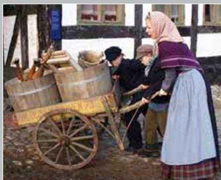
Den gamle by i Århus har levende mennesker, der "bor og arbejder" der om sommeren.

MUSEUMSBESØG Besøg mange af de gratis museer i Århus, f.eks. Antikmuseet, som byder på en kulturel rejse til Middelhavslandenes oldtid. Hvis oldtiden ikke er det der interesserer en, kan man besøge Vikingemuseet, som bogstavelig talt er en rejse tilbage til vikingernes by. Ellers kan man besøge Den Gamle By og ikke blot se fortiden, men også møde fortidens mennesker. Nu skal børnene selvfølgelig ikke glemmes, og til dem har Kvindemuseet en fast udstilling om børn, til børn. Den bygger på konkrete børns liv og handler om familie, sundhed, sygdom, skole, børnearbejde etc.