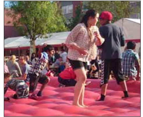
Hoppeborg og -pude var en festlig aktivitet for børnene