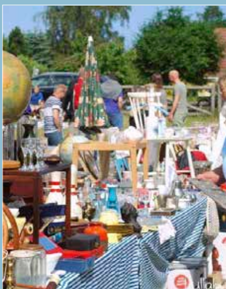
Find loppemarked på sommerens loppemarkeder.

En oplagt mulighed at finde kup til sommerferien – og til en billig pris. Tag på loppemarked med din familie eller med vennerne og få en hyggelig dag. Tjek http://markedskalenderen.dk/ for at finde et marked tæt på dig.