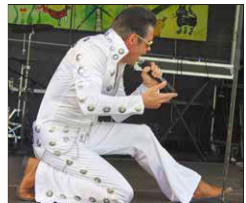
Kirken i Højvangen havde sørget for at flyve Elvis direkte fra himlen til Boulevard-scenen. Mange nød de kendte toner.