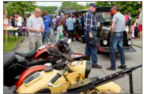
Der var trængsel ved gadgetoget Futti, en populær aktivitet