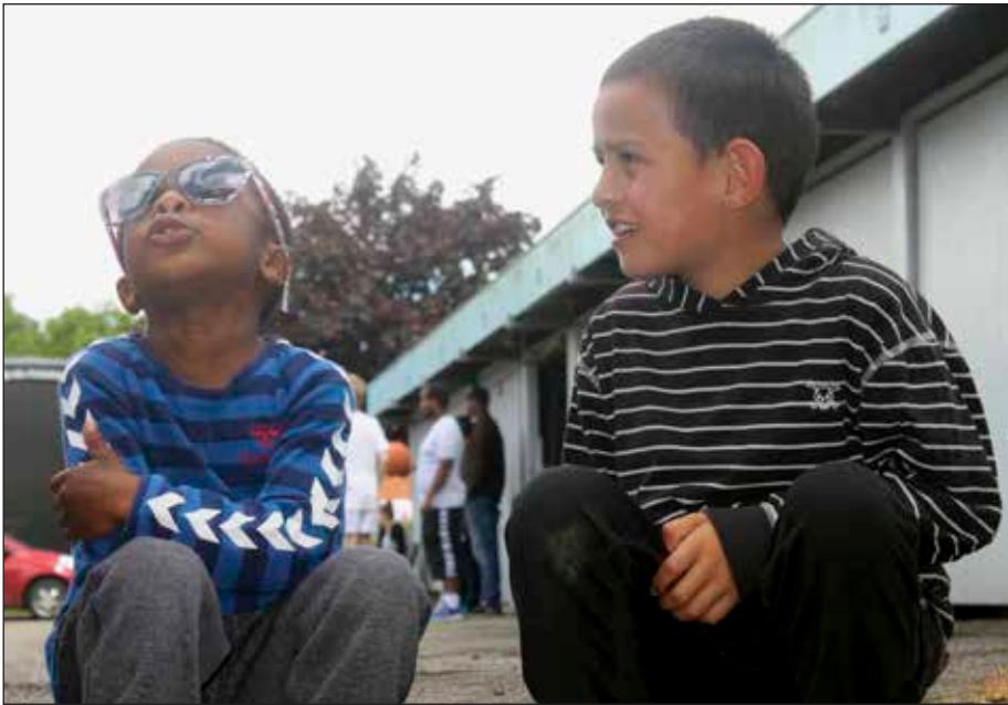
Drengene nød, at der var fest i deres gade