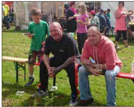
Folk nød solen, hinandens selskab og måske en kold øl, mens de kunne se på ATV opvisning