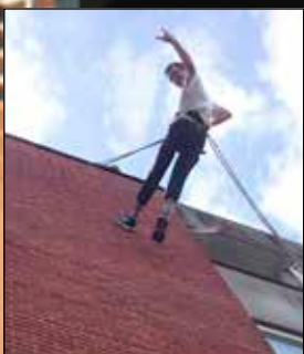
Paw rappeller til sommerfesten