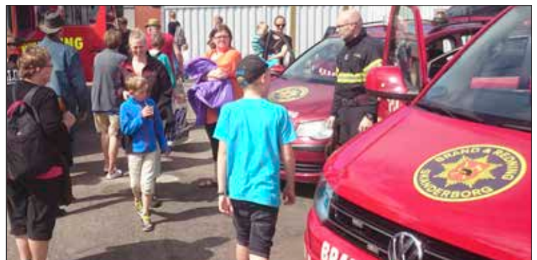
Mange fik en snak og fik set Skanderborg Brand og Redning's beredskab.

Hver onsdag kl.: 19:00-21:00 for alle, Åndehullet Chr. Koldsvej 10, Gavlen. Ferie i juli