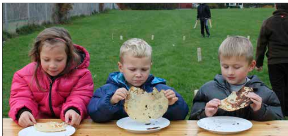
Ahh, pandekager lavet på bål er bare de bedste - spejder gourmet

Derudover vil der torsdag i uge 29 og torsdag i uge 31 være enten en overnatning eller en overnatningstur.