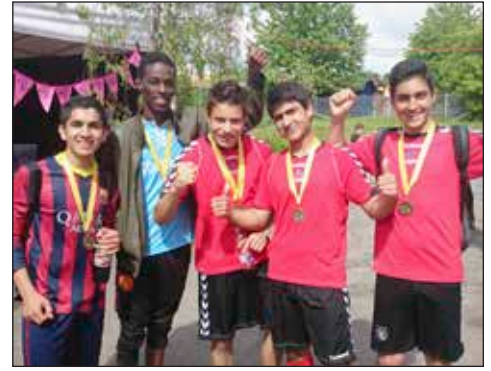
Årets vindere i FC Skanderborgs fodbold turnering, blev det afghanske talenthold. De slog endda et vespillende semipro hold fra Shea.