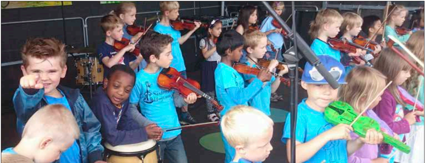
Madtid og alle de andre fra Sistema Højvangen, havde en dejlig dag