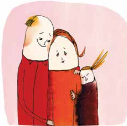
En familie skal stå sammen, når der er problemer. Illustration: Pia Olsen

Børn har brug for nærvær, omsorg og interesse. Med Karen Glistrups ord er det børns trivsel, man har med at gøre, når man snakker om psykiske lidelser i familien. Og når man skåner datteren eller sønnen for