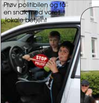
Prøv politibilen og få en snak med vores lokale betjent