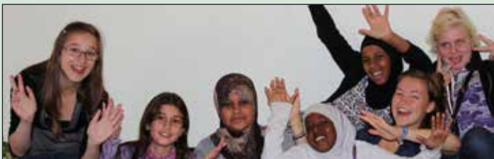
Den 9. april kl.: 18 – 20:30 i beboerhuset på Paul la Cours Vej 31 Arkivfoto er fra Pigeklubben

De unge oplever måske, at forældrenes krav og forventninger er meget anderledes end det, den unge selv ønsker.