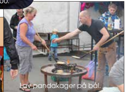
Lav pandakager på bål.