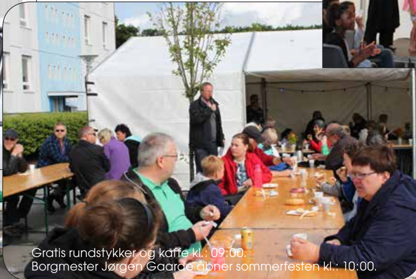
Gratis rundstykker og kaffe kl.: 09:00. Borgmester Jørgen Gaarde åbner sommerfesten kl.: 10:00.