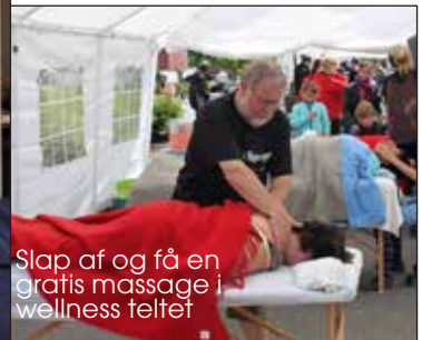
Slap af og få en gratis massage i wellness telter