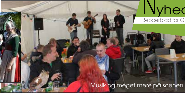
Musik og meget mere på scenen