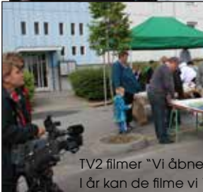
TV2 filmer "Vi åbner dørene". I år kan de filme vi "Brygger vi bro"