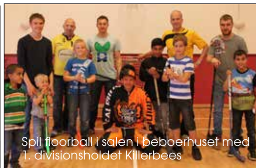
Spil floorball i salen i beboerhuset med 1. divisionsholdet Killerbees