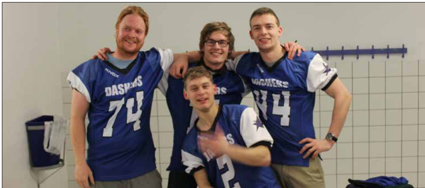
Det sociale betyder meget på Mad Dashers. Her er nogle af spillerne i omklædningsrummet efter træningen.