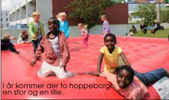
I år kommer der to hoppeborge, en stor og en lille.