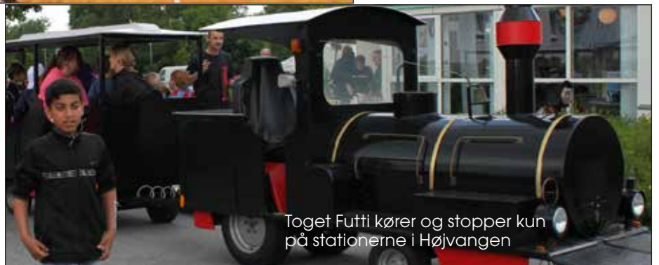
Toget Futti kører og stopper kun på stationerne i Højvangen