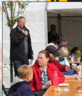
Borgmesteren åbner sommerfesten