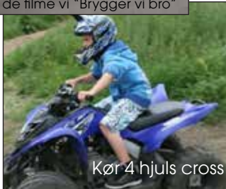
Kør 4 hjuls cross