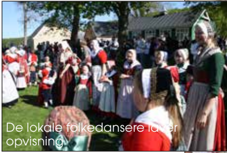
De lokale folkedansere laver opvisning.