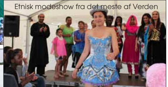
Etnisk modeshow fra det meste af Verden