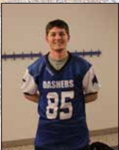
Mad Dashers AFC