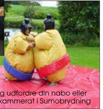
Kom og udfordre din nabo eller klassekammerat i Sumobrydning