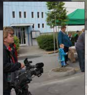
TV2 i Højvangen