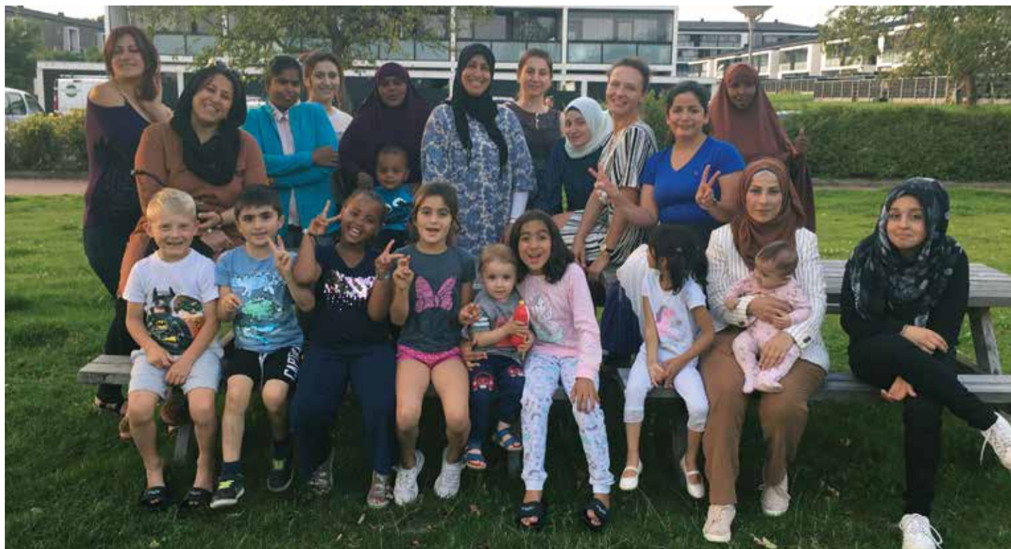
Fællesfoto fra sidste månedsmøde i foreningen "Bydelsmødrene i Skanderborg".

Man skal bare have lyst til at snakke med andre kvinder – måske opstår der ideer til arrangementer, motionsaftaler eller også løser man i fællesskab et konkret problem. Alt sammen i et hyggeligt og uformelt miljø.