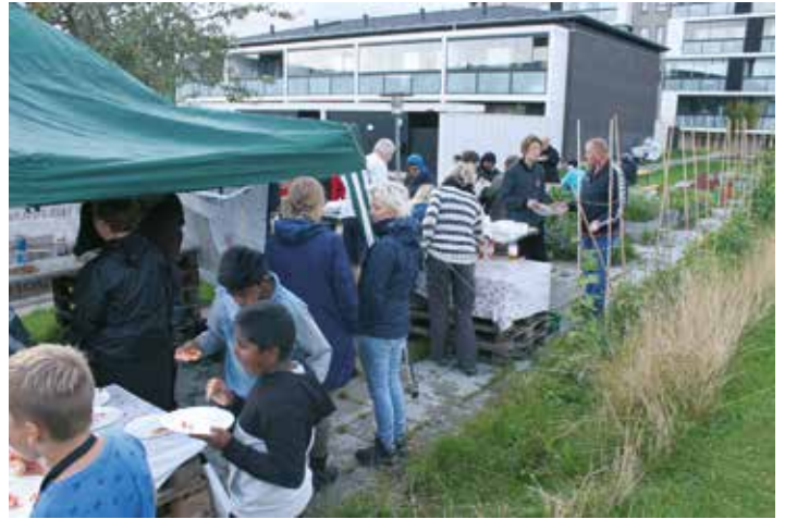
På trods af regn og blæst mødte rigtig mange beboere op for at fejre Haverne i Højvungen.