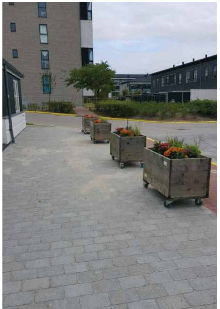
Der er blevet lavet en ny fin terrasse omkring Beboerhuset, sådan at flere gerne skulle få lyst til at opholde sig der. Café-folket har plantet farvestrålende blomster i havekasserne, som nu skaber et hyggeligt miljø ved Beboerhuset.

Vi går nu den mørke tid i møde, vi opfordrer derfor til, at I husker reflekser på jer selv og lys på jeres cykler, når I er ude i området, så vi undgår ulykker. Pas på dig selv i den mørke tid. Bestyrelsen