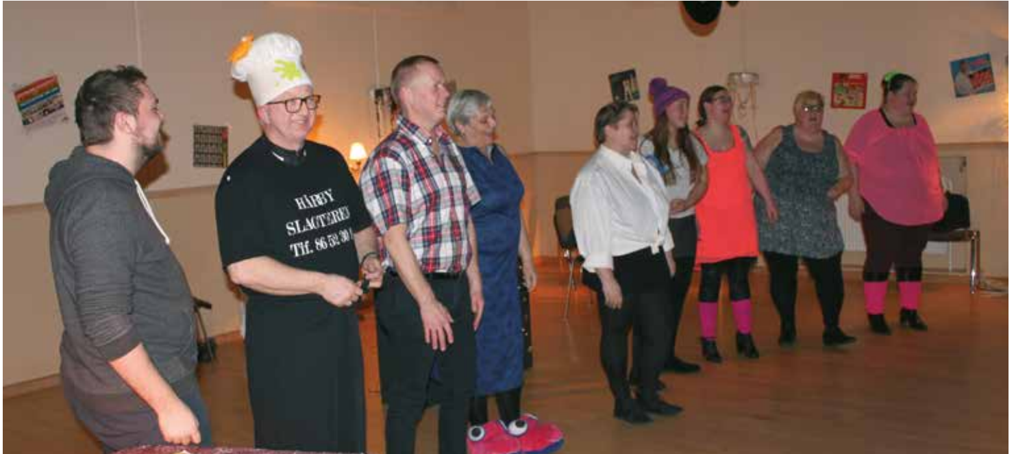
Billedet er fra sidste års cabaret, hvor cabaretholdet havde skabt en forestilling på baggrund af fredags-tv.