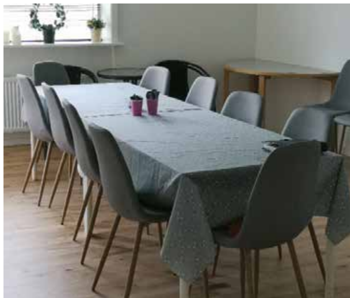
Afdelingsbestyrelsen har i løbet af det sidste år lagt en del kræfter i at få indrettet et kontor i opgang 25. Her holder bestyrelsen deres møder, og beboere kan møde formanden her onsdag i ulige uger kl. 17-19.

Der er gravet op i jorden flere steder, og ikke alle steder ligger det lige fast, så de store vandmængder trak en her del jord med sig - som så blev til store mængder mudder!