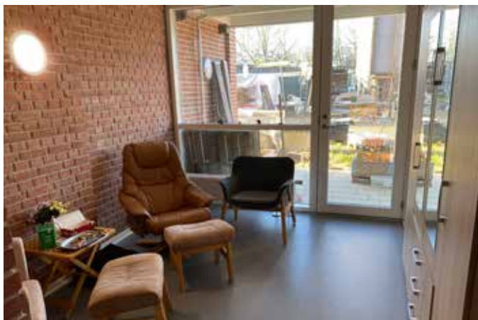
Lejligheden er indrettet med en hygge-krog, hvor man kan smide benene op og slappe lidt af.