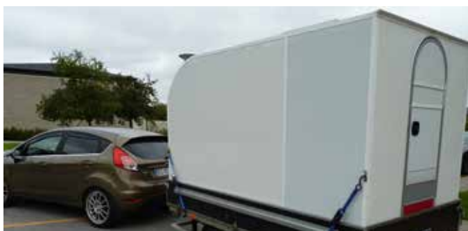
Camperen er fastspændt med solide stropper.