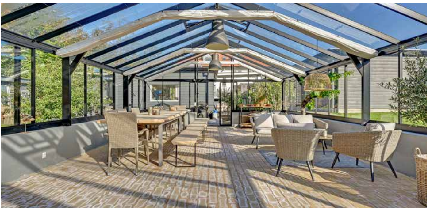
Billedet er af et orangeri tilsvarende det, der kommer på plænen næste år. Dog bliver der ikke murede vægge som her, men glas helt til gulv.

Når man bruger det, bliver der nogle enkle husregler, som skal overholdes. I grove træk skal man selvfølgelig rydde op og gøre rent efter sig. For at sikre at stedet altid er pænt og ikke forfalder, vil der desuden blive en duksetjans, som går på skift blandt en gruppe af frivillige.