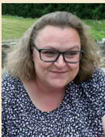
Forside: Maiken Poulsen

Opgangen udgives af Projekt Højvangen, Afdeling 17 (SAB), Afd. 39 (Midtjysk Boligselskab)