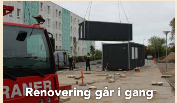
Renovering går i gang