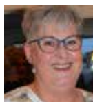
Eva Vejle Trailer MC-skure Kælderrum