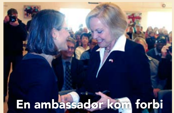
En ambassadør kom forbi

Når vi når slutningen af 2021, så lukker døren til det Opgangen, som vi kender. Igennem de år har bladet været i en konstant udvikling. Det bliver tydeligt, når man bladrer igennem stakken af blade fra de ti år. Masser af beboere har været inde over bladet – både som producenter af artikler og som kilder til historier fra området. Opgangen er blevet et stykke af Højvangens historie, som nu er blevet indhentet af teknologi og sociale medier. Vi har været på et lille nostalgitrip i gemmerne for at se, hvordan beboerbladet har udviklet sig gennem tiden. Og vi har zoomet ind på nogle af de artikler, der har været bragt.