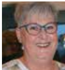
Eva Vejle Trailer MC-skure Kælderrum