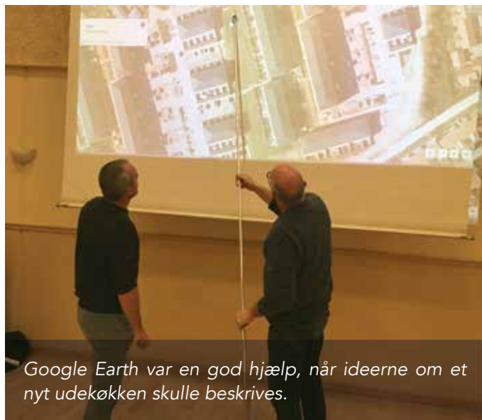
Google Earth var en god hjælp, når ideerne om et nyt udekøkken skulle beskrives.