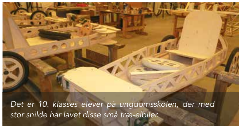
Det er 10. klasses elever på ungdomsskolen, der med stor snilde har lavet disse små træ-ebiler.