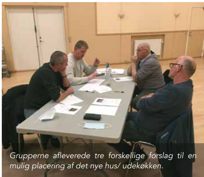
Grupperne afleverede tre forskellige forslag til en mulig placering af det nye hus/ udekøkken.