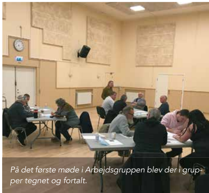
På det første møde i Arbejdsgruppen blev der i grupper tegnet og fortalt.