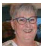
Eva Vejle Trailer, kælderrum

Find os på Facebook Bestyrelsen Afd 17 SAB