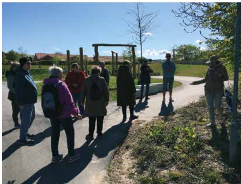
Hen over foråret har modige beboere draget med Winnie på jagt efter vild mad.