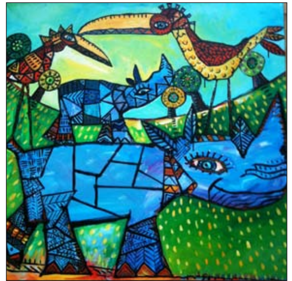
Malet af Piet Pedersen