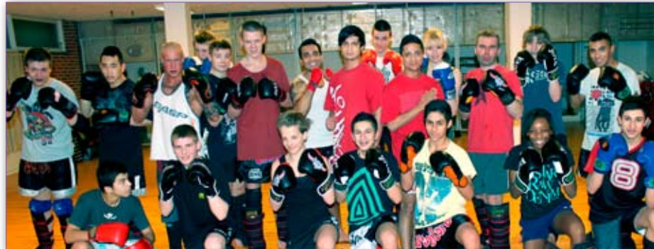
Med støtte fra Skanderborg kommune, åbnede bokseklubben Colosseum i nye lokaler d. 8. august 2011, i MB Hallen.