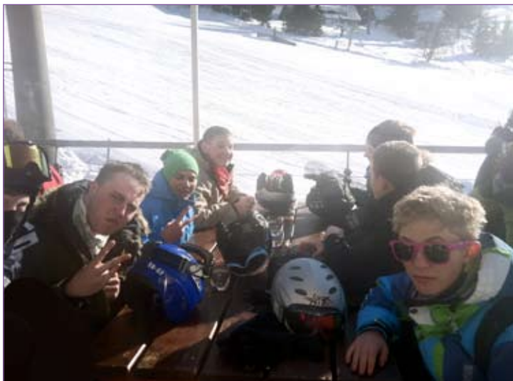
Her ser vi en gruppe sultne glade unger, som venter på deres frokost på en restaurant lige ved pisten.