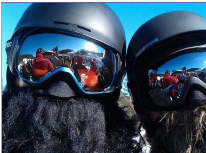
Tid til sjov og spas i det dejlige blå vejr.

KLUB'N HØJVANGENS FRITIDS- OG UNGDOMSKLUB