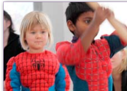
Med smil, spænding og fælles hjælp, blev de tre tænder slået til pindebrænde, i beboerhuset.