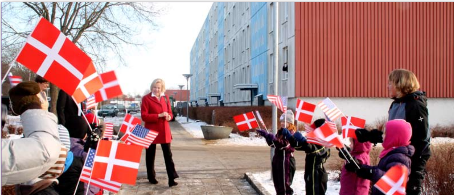
Højvengen fik d. 7 februar, fornemt besøg, af den amerikanske ambassadør. Laurie Fulton.