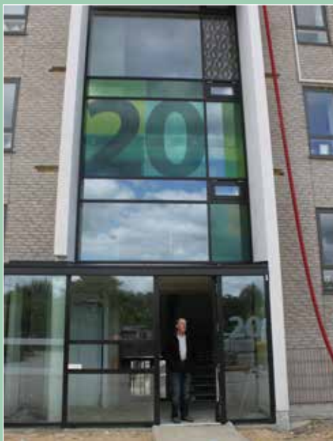
Flotte mursten, tag og indgangsparti, præger den nyrenoverede opgang.