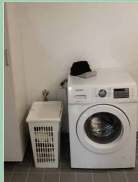
Der er god plads på badeværelset, til bl.a. vaskemaskine.