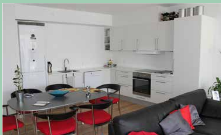
Der er god plads og luft, i det nye køkkenalrum.

Renoveringen i opgang 20 er ved at nærme sig sin afslutning. Selve renoveringstiden har været længere end først antaget. Selve lejlighederne er nu færdige, men der mangler følgende som udbedret jr. nedenstående.