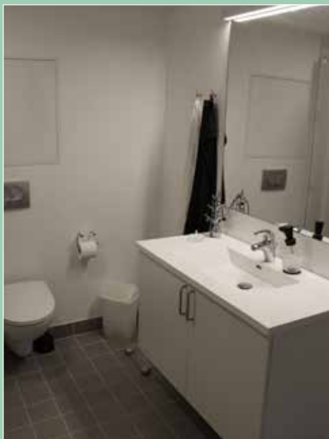
Nyt stort og flot badeværelse med varme i gulvet.