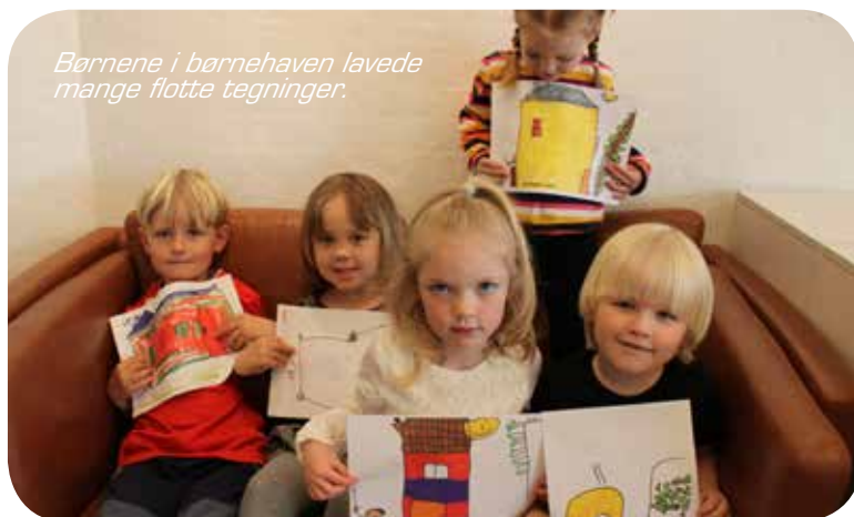
Børnene i børnehaven lavede mange flotte tegninger.