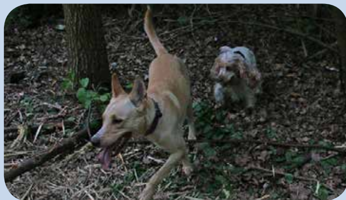
Hundene Freja og Smilla leger allerede i skoven.