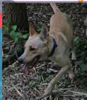
Hundelegeplads i Højvangen