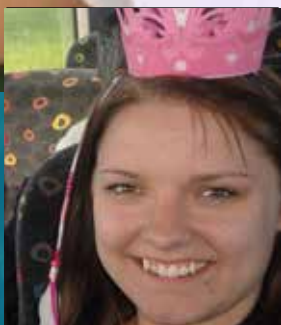
Sommerudflugt med afd. 17