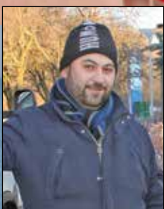
Grønthandler i Højvangen