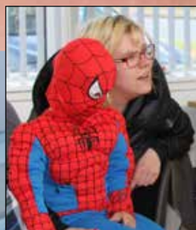
Fastelavn 10/2 Tilmelding på bagsiden