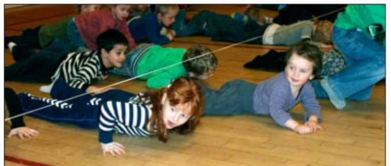
Først under elastikken, lidt længere henne - over elastikken, det er sjovt!