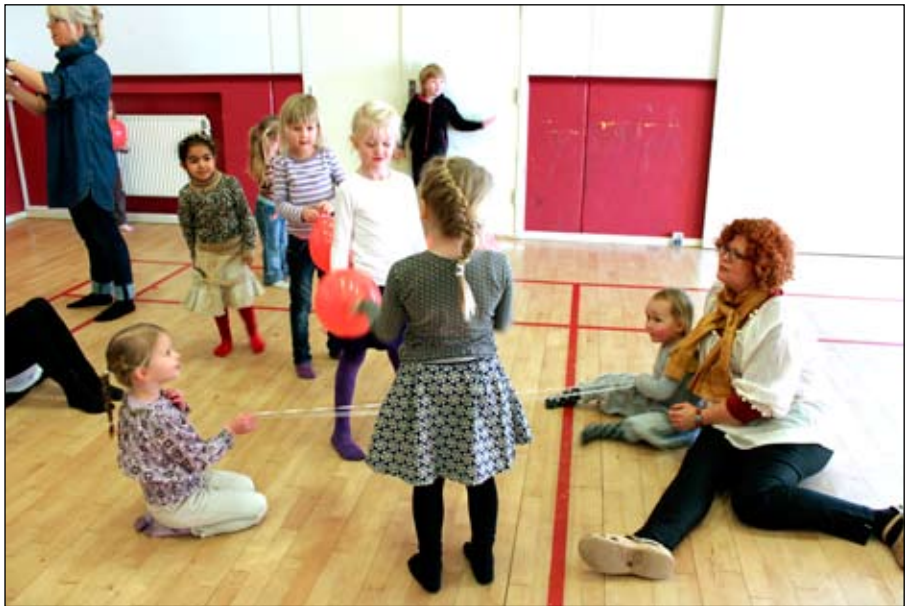
Pigerne hopper elastik