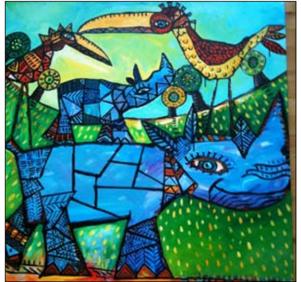
Malet af Piet Pedersen

Har du et godt navn til cafeen? Flere muligheder er i spil, men lad os lige høre fra dig :-)