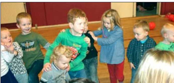
Der danses boogie woogie, med stor koncentration