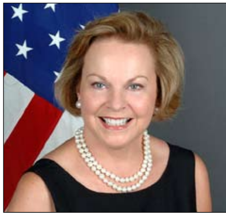
Den amerikanske ambassadør besøger Højvangen d. 7/2 kl. 11:30