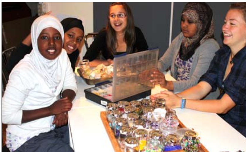
Pigeklubben der hygger sig, med at lave perler

Er det noget for dig? De har brug for din hjælp!