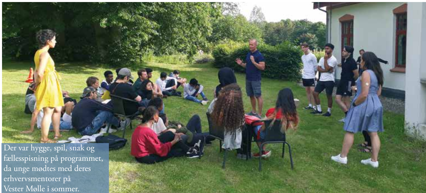
Der var hygge, spil, snak og fællesspisning på programmet, da unge mødtes med deres erhvervsmentorer på Vester Mølle i sommer.

job, hvordan man kan finde et fritidsjob og hvad der kan være svært ved have et fritidsjob. Erhvervsmentorerne hjælper for eksempel de unge flygtninge med at skrive en ansøgning, eller kommer med gode ideer til, hvad de unge skal sige, hvis de skal til samtale eller aflevere en ansøgning hos en virksomhed. Hvis de unge har svært ved at forklare deres forældre, hvorfor de gerne vil have et fritidsjob, kan de også snakke med en mentor om det. Erhvervsmentoren kan også være 'en ven', og tale med en ung om alt muligt andet end fritidsjob, hvis det er det, -