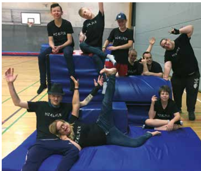
Uden et trofast hold af frivillige hjælpere kunne der ikke laves et Storlegeland to gange om året i Højvangen.

- Det er bare så skønt, at de store unger også stadig kommer her. De var jo med, da de var mindre, og nu er de enten frivillige her, eller kommer og hænger ud med deres venner, siger hun.