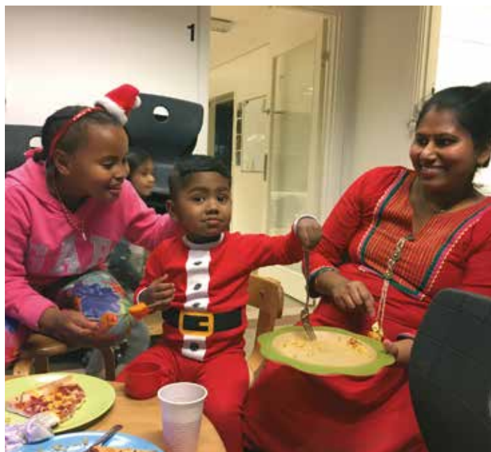
Tirsdag 26. november samledes næsten 40 bydelsmødre og børn til den årlige julefrokost, hvor der var sanglege, julesange, pakkelege og julehygge.

- De kvinder, Bydelsmødrene hjælper, har i den grad brug for opbakning. De kæmper for, at deres børn får en bedre tilværelse, end den de selv har haft. De vil gerne ud af deres isolation, de vil gerne hjælpe, og de vil gerne have et job. Vi arbejder med kvinderne, med deres familier, med sundhed, trivsel, antivold, børneopdragelse, demokrati og meget andet.