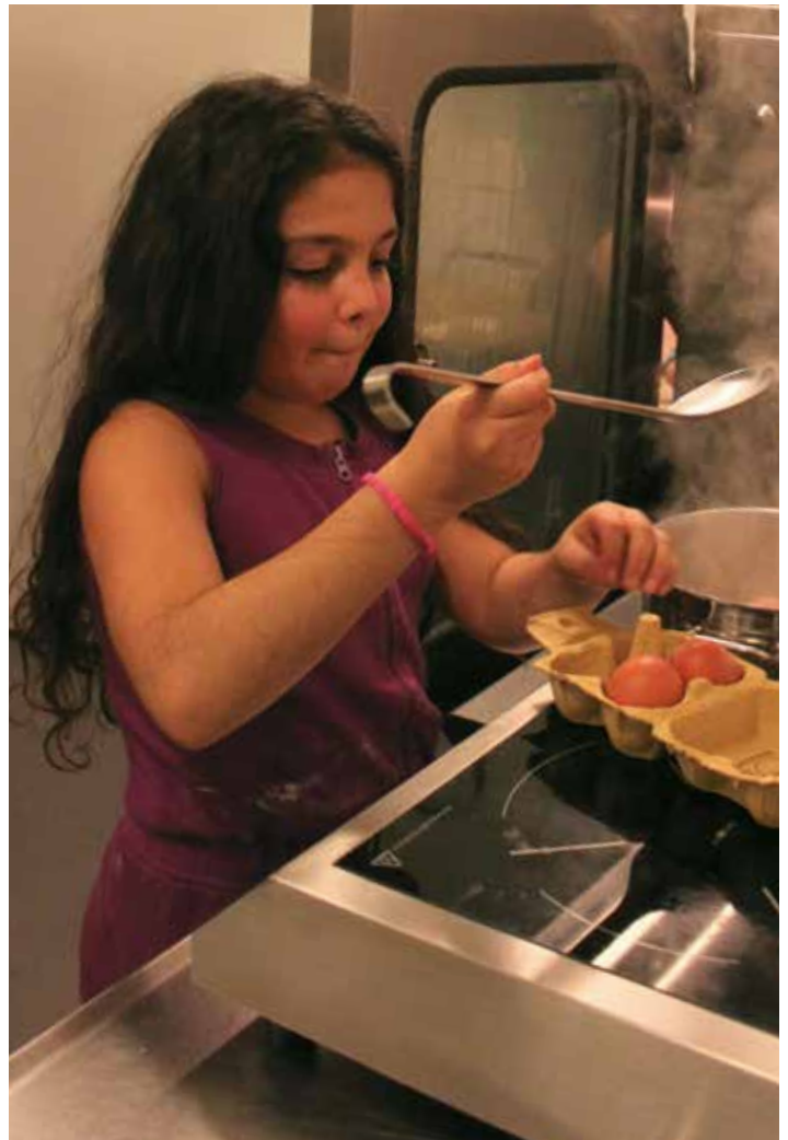
Nargham kan også rigtig godt lide at kokkere.

Snakken flyder på kryds og tværs i spisesalen, der summer som en bikube.