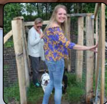
Hundelegepladsen næsten klar