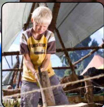
FDF i Højvangen