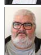
Frank Nielsen Diverse papirer