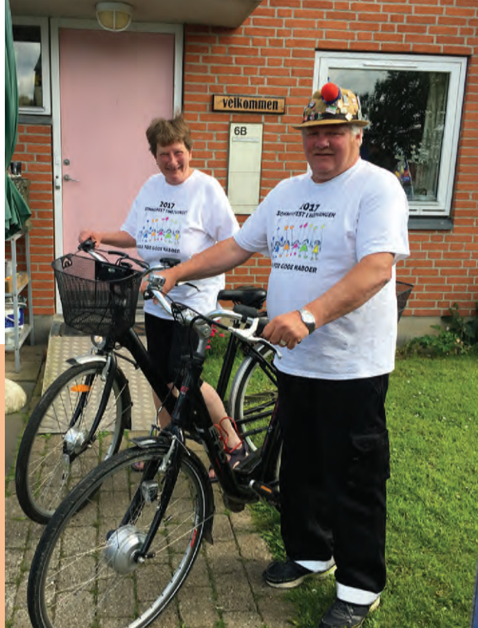
Ægteparret tager elcyklerne frem når de skal ud i verden.

"Hun var i hvidt, limousinen ligeså, og om aftenen var der mad udefra, taler, levende musik og dans"