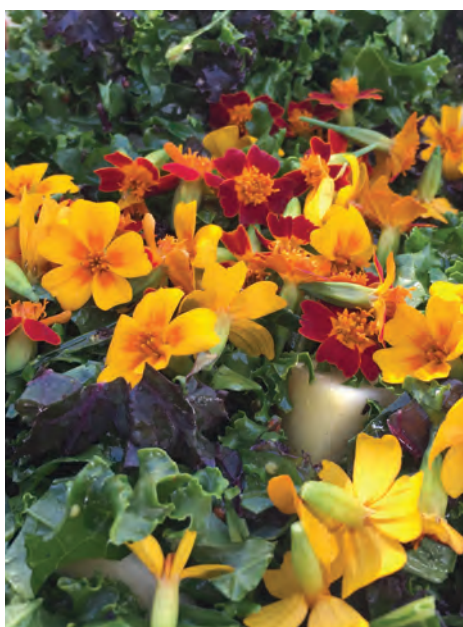
Flotte farver i haven.