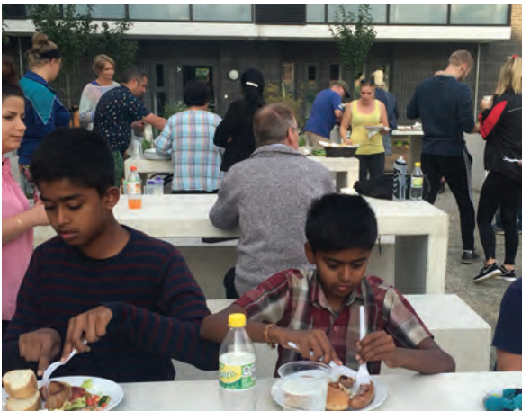
Haveholdet serverede lækker mad - lavet af egne råvarer i grillområdet på Chr. Koldsvej.