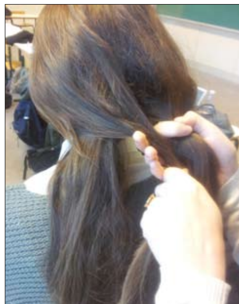
3. Før den lille tot hår over venstre del ind mod midten til den højre del.