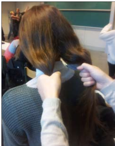
1. Del håret op i to lige store dele (lav evt. en hestehale først.)