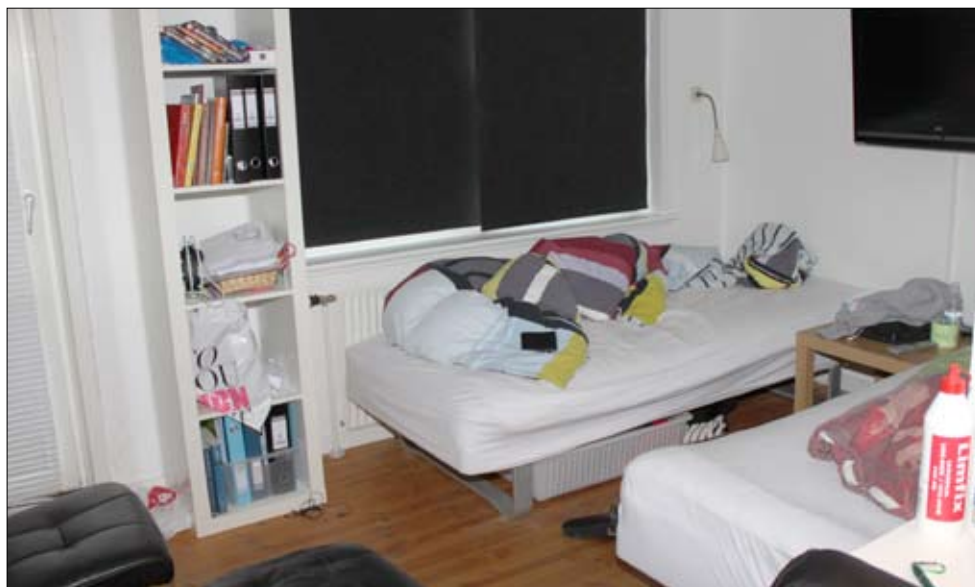
Et indblik i hvordan de unge spillere bor. Lejlighederne er ikke særlig store, men kan lige klare, der bor 2 friske fyre.