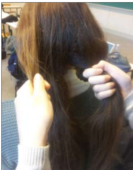
2. Tag en lille tot hår fra den yderste venstre del af håret.