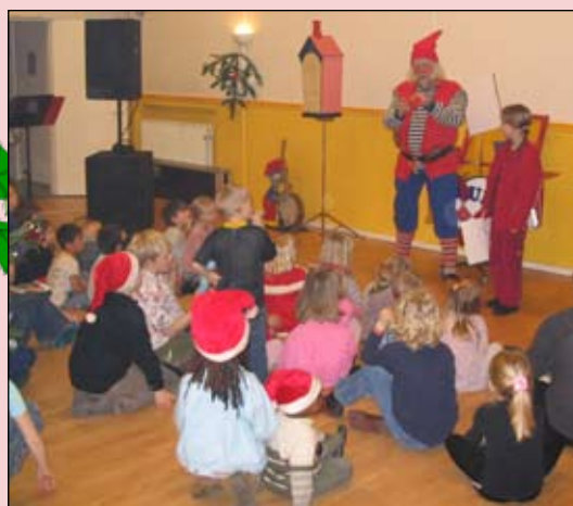
Julemanden i beboerhuset

Børn & Unge i Skanderborg Folkedanserforening