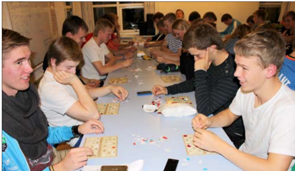
Håndbold er ikke det eneste, de unge i SHEA spiller. Her bliver der spillet en omgang bingo i fælleshuset.