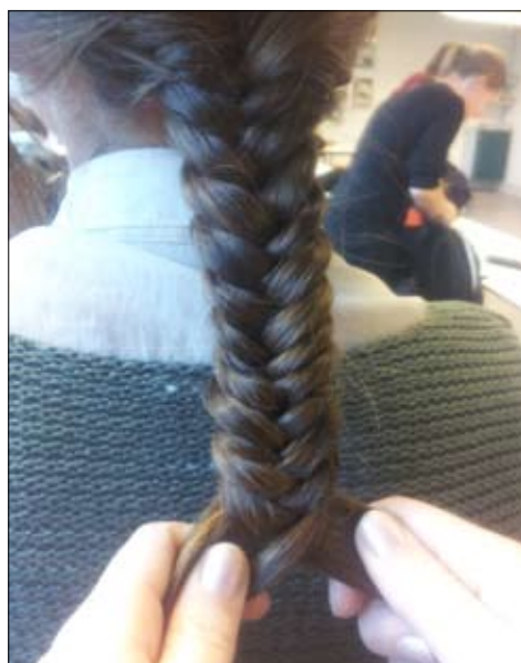
6. Sådan forsættes indtil hårets ende.