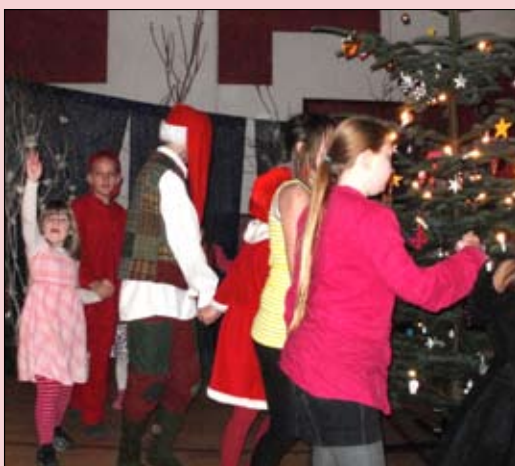
Højt fra træets grønne top.

Tilmeldingsseddel til juletræsfesten bliver delt ud senere så hold øje med din postkasse.