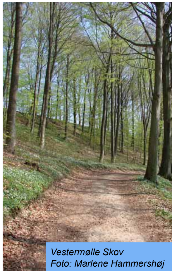
Vestermølle Skov

Opgangen udgives af afdeling 17 fra SAB, afdeling 39 fra Midtjysk Boligselskab samt Projekt Højvang